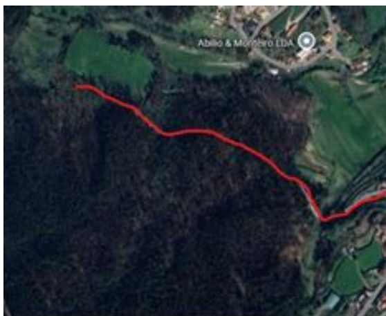
Figura 1: Identificação dos limites da via proposta

A proposta toponímica referida foi aprovada em reunião ordinária do executivo da Junta das Freguesias de Arentim e Cunha , realizada no dia 03/09/2024 (Ata n.º 43), na qual aprovou por unanimidade, o seu ponto quatro relativo “à atribuição da toponímia Caminho da Caínha ”.